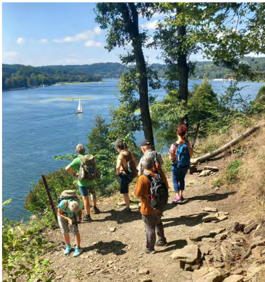
Am Baldeneysee, Foto: Klaus Krampe